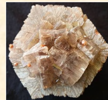
Aragonite (Bastennes - 40)