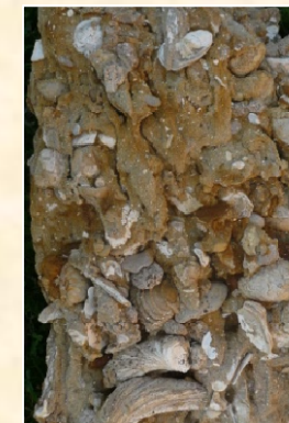
Grès coquillier avec Lamellibranches d'âge miocène (Bougue - 40)