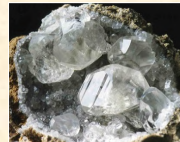
Calcite « diamant » (Gave de Pau - 64)