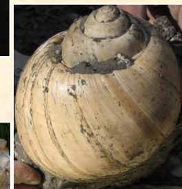
Gastéropode d'âge oligocène (Gaas - 40)