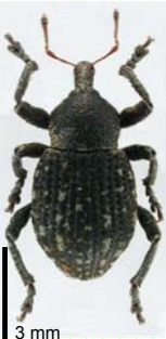
3 mm Donus bonvouloiri Capiomont, 1867