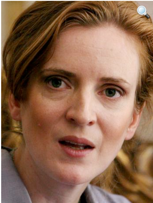
Nathalie Kosciusko-Morizet, ministre de l'Ecologie

Est-il vraiment nécessaire de couper les 42 000 platanes qui bordent le canal du Midi ?