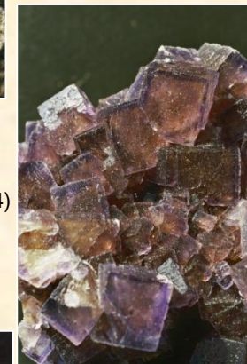
Fluorite (Arbouet - 64)