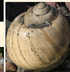
Gastéropode d'âge oligocène (Gaas - 40)