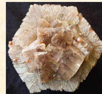
Aragonite (Bastennes - 40)