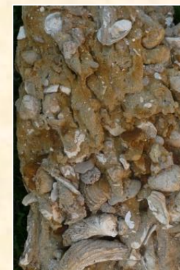
Grès coquillier avec Lamellibranches d'âge miocène (Bougue - 40)