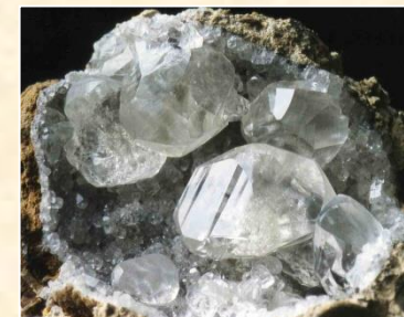
Calcite « diamant » (Gave de Pau - 64)